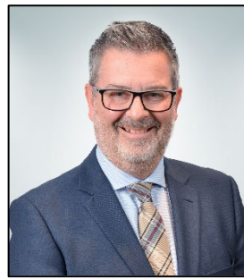
Mario Bastille Ville de Rivière-du-Loup