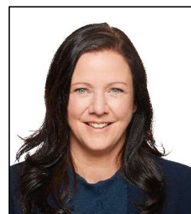
Amélie Dionne Députée provinciale