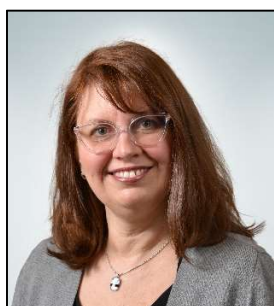
Hélène Marquis Services Québec